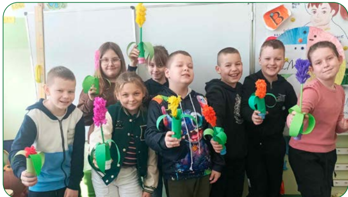
Klasa III SP Kokoczek rozpoczęła przygotowania do wiosny i Wielkanocy. Na początek uczniowie z wychowawczynią wykonali kwiaty.