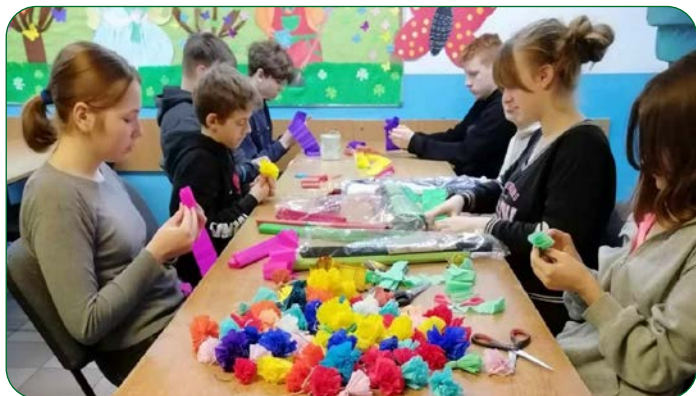
Uczniowie kl. VII SP Grzybno wykonali własnoręcznie kwiaty z krepki do palemek wielkanocnych.