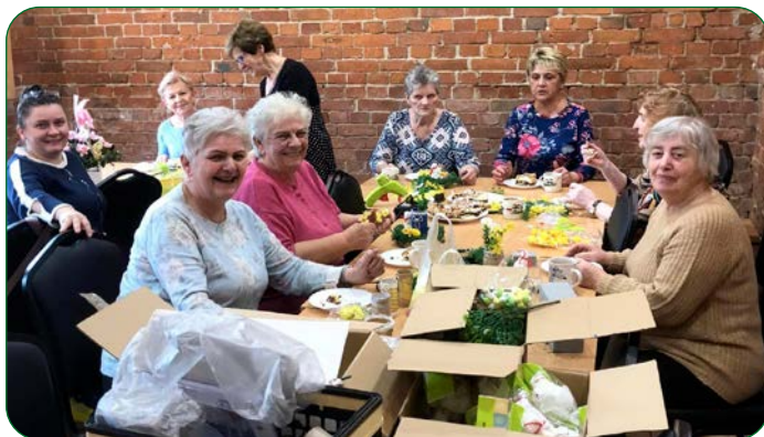
Panie z KGW Unisław zakasały rękawy i zabrały się do robienia wielkanocnych ozdób.