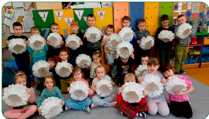
Dzieci z grupy „Pracusię” z Przedszkola Gminnego „Krasnoludek” w Unisławiu, przygotowując się do Świąt Wielkanocnych, wykonały baranki z torebek śniadaniowych.