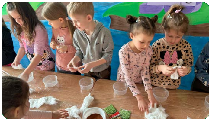
Dzieci z Niepublicznego Przedszkola „Zielony Zakątek” w Kokocuku - grupa „Myszki”, rozpoczęły swoje przygotowania do Świąt Wielkanocnych od zasiania rzeżuchy. (MW)