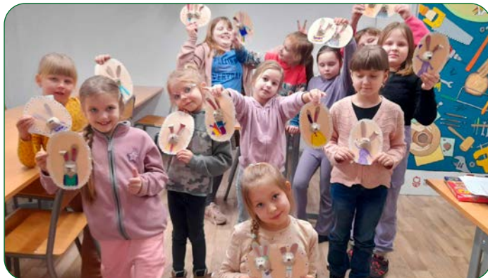
Dzieci na zajęciach plastyczno-technicznych w GOK-u wykonały świąteczne portrety zajączków.