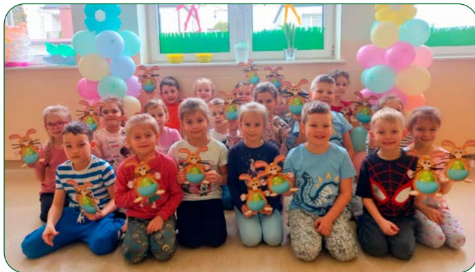
Grupa „Zajączki” z Niepublicznego Przedszkola „Zielony Zakątek” w Unisławiu uwielbia przygotowania do świąt. Dlatego wykonała tematyczną pracę plastyczną - zajączka wielkanocnego oraz zasiała owies.