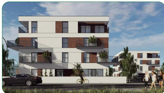
A tak nowe obiekty mają wyglądać.

Będziemy Państwa na bieżąco informować o postępach tej inwestycji.