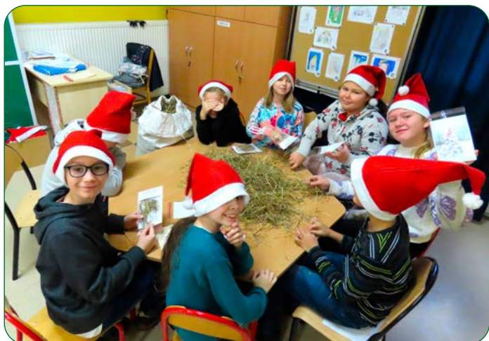
Tradycyjnie w Niepublicznej Szkole Podstawowej w Brukach Unisławskich uczniowie pakowali sianko przeznaczone na wigilijne stoły.