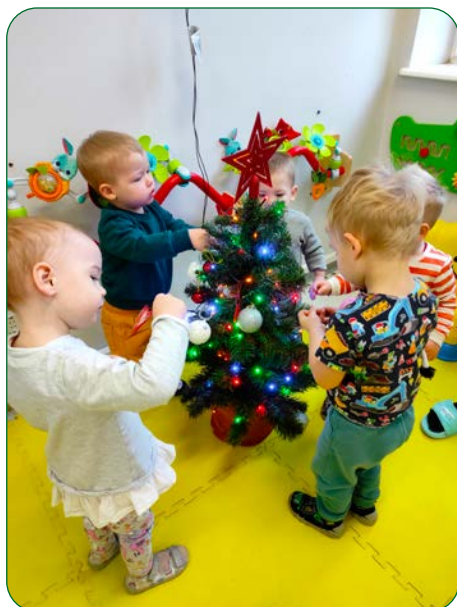
Klubik Dziecięcy „Miś i Margolcia” w Unisławiu jest wypełniony po brzegi świąteczną atmosferą. A to wszystko dzięki ustrojonej przez dzieci choince, bogatej w kolorowe, mieniące się ozdoby.