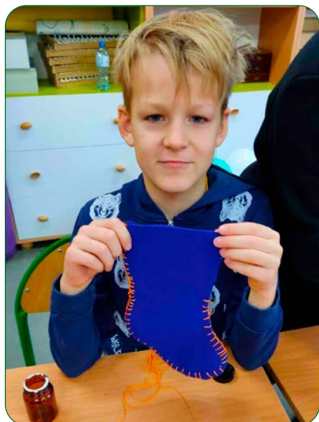
W Szkole Podstawowej w Kokocku wszyscy są już gotowi na prezenty! A to dlatego, że klasa 5 wykonała własnoręcznie świąteczne skarpety, w których dzieci z pewnością będą mogły znaleźć podarunki od Świętego Mikołaja.