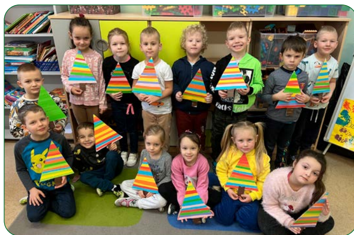
Dzieci z Niepublicznego Przedszkola „Zielony Zakątek” w Grzybnie starannie wykonały piękne choinki z pasków papieru.