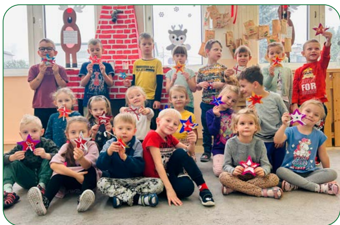
Przedszkolacy z grupy „Liski” z „Zielonego Zakątka” w Unisławiu szlifowali swoje plastyczne umiejętności i stworzyli różnorodne gwiazdki z ozdobnego papieru.