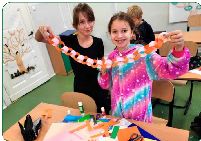
Uczniowie Szkoły Podstawowej w Grzybnie wprowadzili świąteczny klimat w klasie, tworząc piękne łańcuchy z kolorowego papieru.