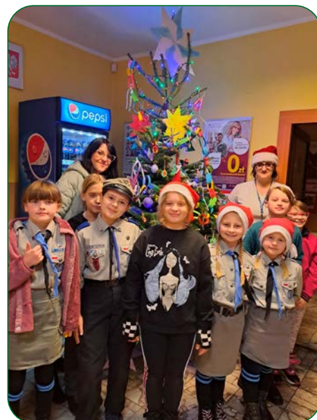
Zielone drzewko w placówce Poczty Polskiej w Unisławiu zostało przyozdobione we własnoręcznie przygotowane ozdoby choinkowe. A to wszystko za zasługą naszych harcerzy i zuchów.