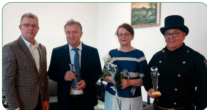
Laureaci powiatowego konkursu nagrodzeni przez Starostę Chełmińskiego.