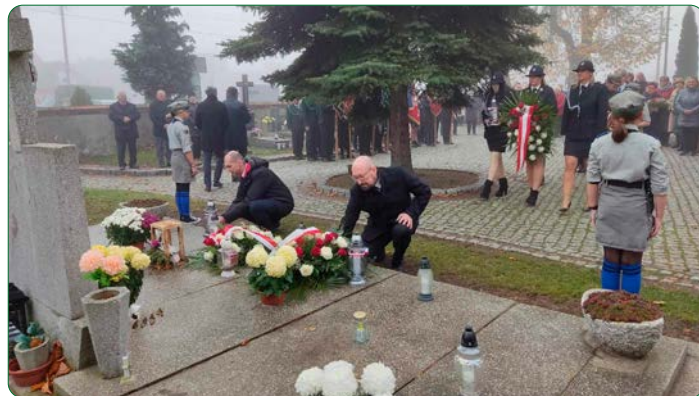
W dniu Narodowego Święta Niepodległości odbyła się uroczysta msza święta w intencji Ojczyzny w kościele w Unisławiu.