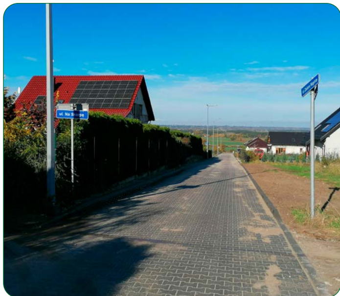
Ulica Zielone Wzgórze w Unisławiu zmieniła swoje oblicze.