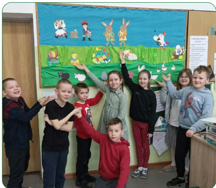
Klasa 2 SP Kokocko rozpoczęła przygotowania do wiosny i Wielkanocy. Na początek uczniowie z wychowawczynią wykonali gazetkę tematyczną.