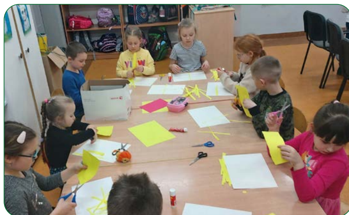
W świetlicy szkolnej dzieci również zakasały rękawy i przyłączyły się do tworzenia świątecznych ozdób.