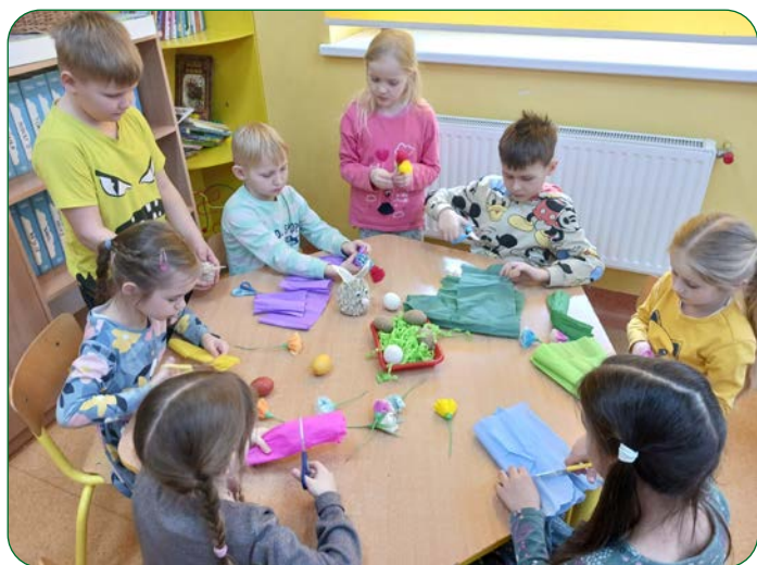
Grupa Pracusie z Przedszkola Gminnego „Krasnoludek” wykonała własnoręcznie ozdoby świąteczne: jajka, kwiatki i zajęczki.