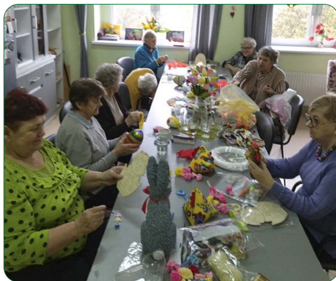
W Dziennym Domu Pobytu Seniora w Unisławiu uczestnicy zajęć zakasali rękawy i zabrali się do robienia wielkanocnych ozdób.