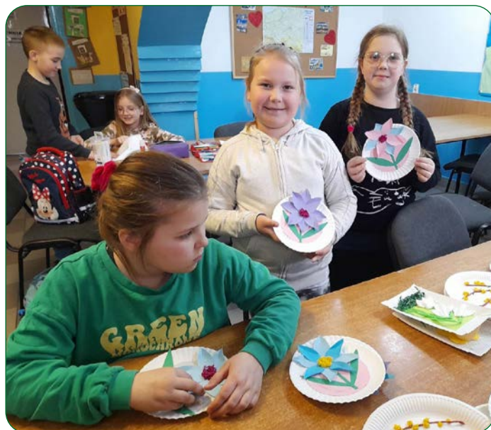
Z wiosennym nastawieniem i pełni zapału uczniowie klasy II SP w Grzybnie wykonali wiosenne ozdoby, które upiększają szkolną świetlicę.