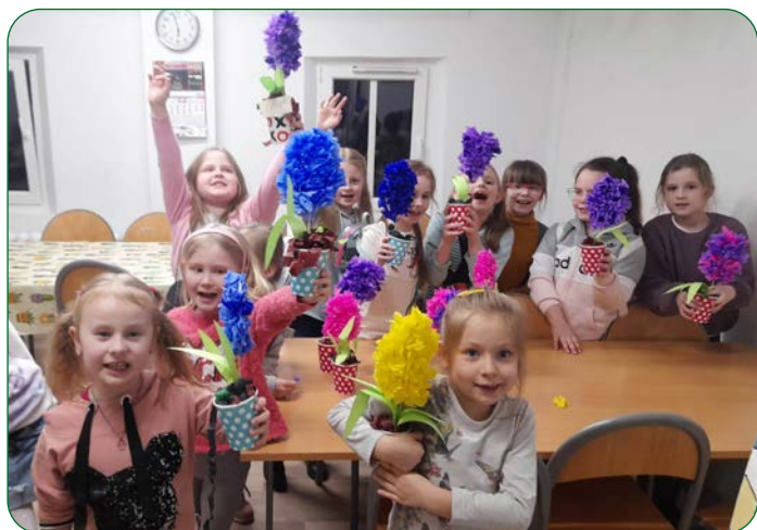
Dzieci na zajęciach plastyczno-technicznych w GOK-u wykonali przedświąteczne dekoracje i wielkanocne kartki.